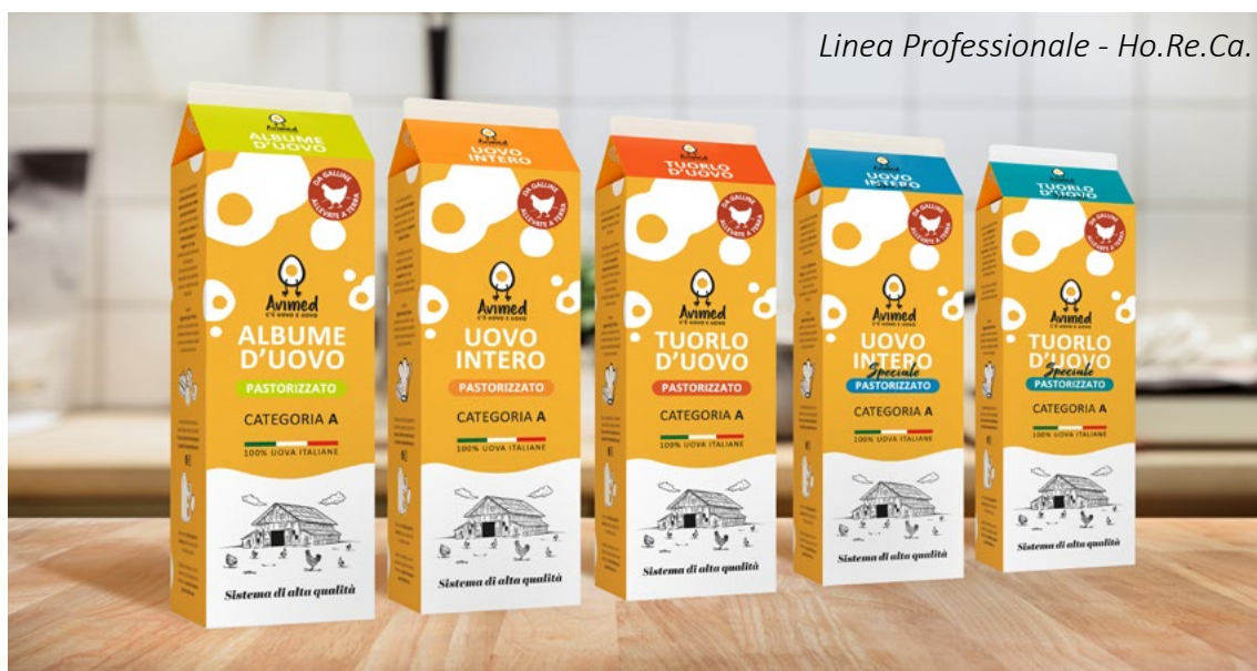
Linea Professionale - Ho.Re.Ca.

Gli ovoprodotti, declinati negli esclusivi tuorlo, albume e uovo intero e, per un tocco di colore in più, anche in tuorlo Speciale e intero Speciale (a pasta gialla), sono disponibili nel formato Brik (Gable Top) da 1 Kg e nei più grandi e pratici "Bag in Box" da 5 Kg, 10 Kg, 20 Kg; è disponibile inoltre anche il maxi formato per i medi e grandi pastifici in pallet box da 500 Kg e pallet con 1000 Kg. Per i clienti più esigenti, è possibile realizzare e confezionare specifiche referenze personalizzate secondo i PPM necessari per le proprie produzioni.